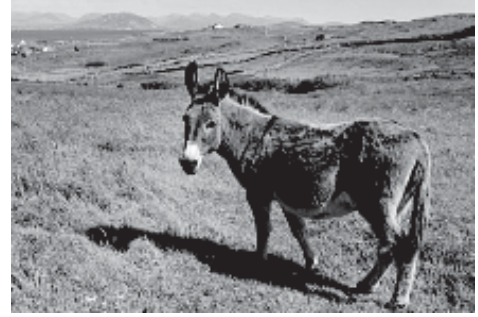
चित्र 9.2 खच्चर

के वांछनीय गुण सम्मिलित हो जाते हैं तथा इस संतति का पर्याप्त आर्थिक महत्त्व होता है; जैसे- खच्चर (चित्र 9.2)। क्या आप जानते हैं कि खच्चर की उत्पत्ति किस संकरण का परिणाम है?